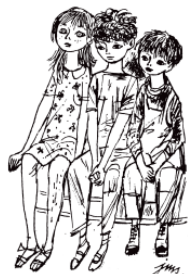
Dzieci siedziały nieruchomo jak poszki.

atrakcyjności dodaje znakomita oprawa edytorska – mistrzowskie ilustracje są w nich odświeżone i znakomicie wyeksponowane, zyskując blask, którego przed laty nie mogła im dać uboga peerelowska poligrafia. Połączenie najwyższej jakości literackiej, graficznej i edytorskiej tworzy całość, której nie sposób się oprzeć – czego dowodem uznanie czytelników i liczne przyznane serii wyróżnienia i nagrody.