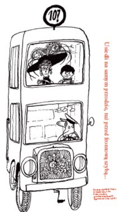
Usiądź na samym przodku, tuż przed kierowcą syh...

Wystawa powstała ze środków Ministra Kultury i Dziedzictwa Narodowego (w ramach programu „Literatura i czytelnictwo”) i dotychczas była prezentowana na 13. Targach Książki w Krakowie, 18. Wrocławskich Promocjach Dobrych Książek, w Bibliotece Śląskiej w Katowicach przy okazji konferencji Książka dla dzieci – jak to się robi? , na 16. Międzynarodowych Targach Książki w Pradze), na 55. Międzynarodowych Targach Książki w Warszawie, na Pikniku Literackim z okazji Dnia Dziecka w Muzeum Literatury w Warszawie, w holu Biblioteki Uniwersytetu Warszawskiego, w Muzeum Zabawek i Zabawy w Kielcach, oraz kilkudziesięciu innych instytucji kulturalnych i oświatowych z całej Polski.